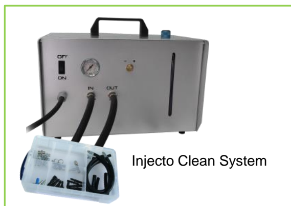
Injecto Clean System